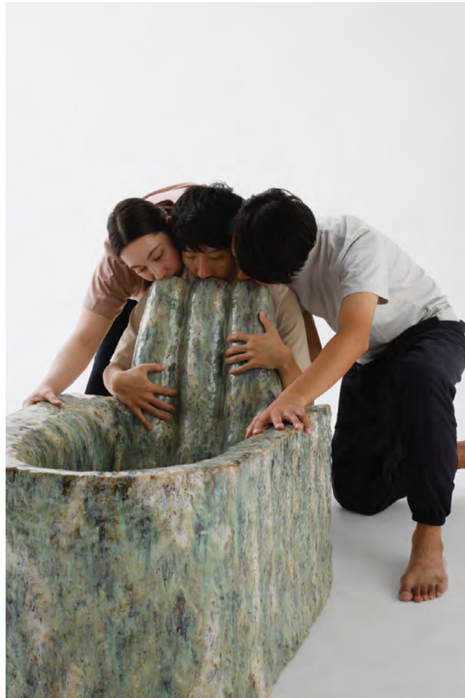
西條茜 作品名未定 2024年制作