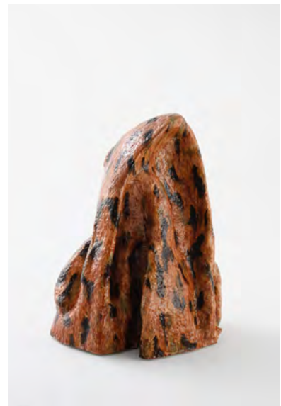
西條茜 作品名未定 2024年制作