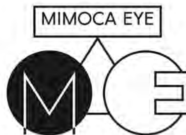
「MIMOCA EYE/ミモカアイ」 ロゴ