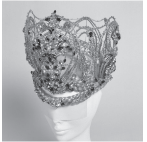
1. Courtesy of ANREALAGE